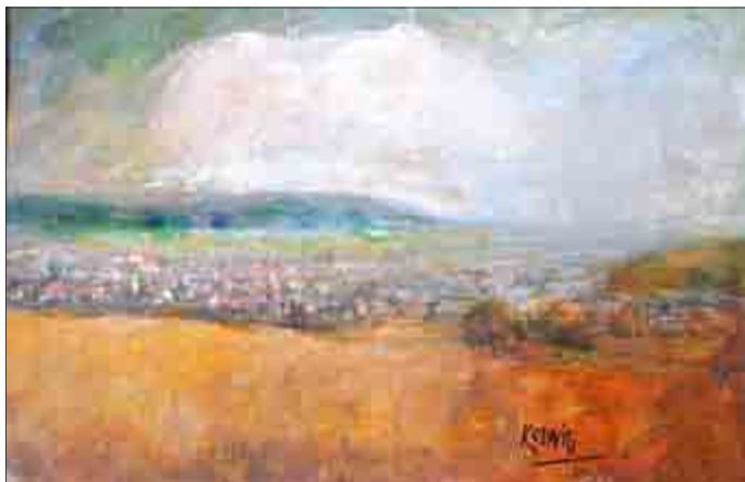
Klaus-Dieter Kerwitz: Blick auf Worbis 2014