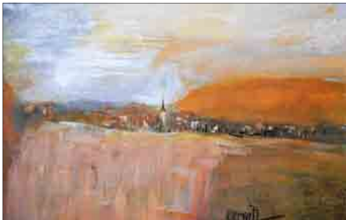
Klaus-Dieter Kerwitz: Bei Bischofferode 2014

In der Ausstellung unter dem Titel: „In Erinnerung unterwegs“ - Klaus-Dieter Kerwitz: Malerei, Zeichnung und Druckgraphik werden ca. 60 Arbeiten in unterschiedlichen Techniken (Öl, Aquarell/Bleistift, Acryl/Bleistift, Kreide/Öl, Acryl/Öl sowie Druckgraphik insbesondere Radierung) gezeigt.