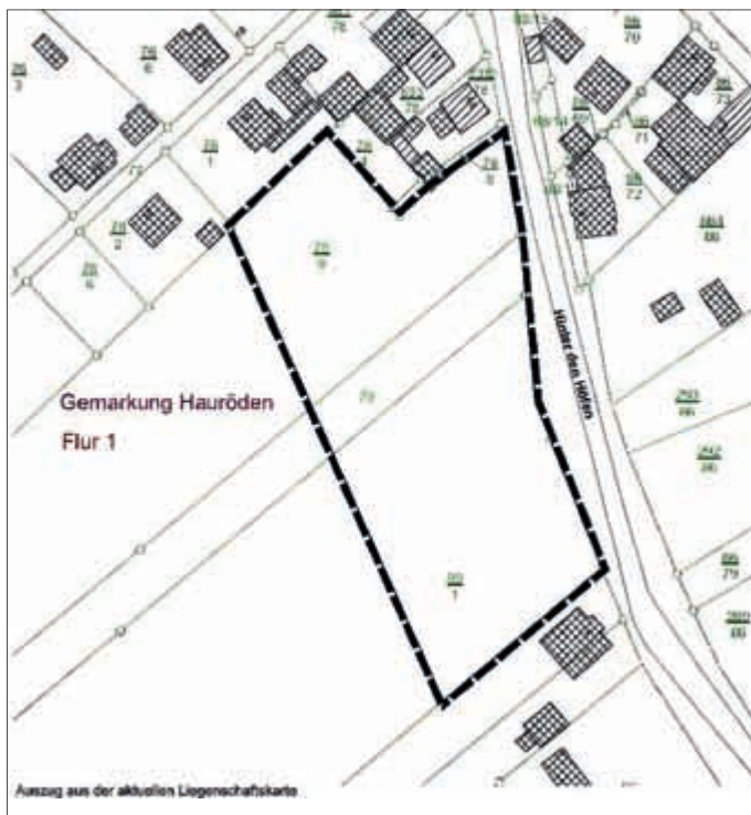
Darstellung ohne Maßstab