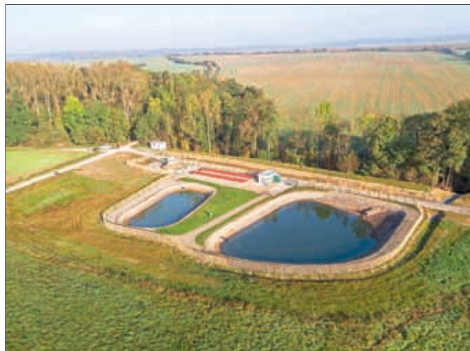
Die Kläranlage Schildbach leistet einen wesentlichen Beitrag zum nachhaltigen Umwelt- und Gewässerschutz gemäß den Anforderungen der Europäischen Wasserrahmenrichtlinie.

Die Verknüpfung von Nachhaltigkeit und Effizienz in der Wasserwirtschaft findet sich oftmals in der intelligenten Verbindung naturnaher und technischer Lösungsansätze. So betreibt die EW Wasser GmbH, Betriebsführerin des Zweckverbands Wasserversorgung und Abwasserentsorgung Obereichsfeld (WAZ), bereits diverse Kläranlagen als Kombination von Scheibentauchkörpern und Schönungsteichen/Biofiltern: in Katharinenberg (Inbetriebnahme: 1993), in Wüstheuterode (2004), in Berka vor dem Hainich (2008), in Küllstedt/Büttstedt (2009), bei Arenshausen mit der Kläranlage Unteres Leinetal (2012), in Birkenfelde (2017) und Schildbach bei Lengefeld (2017). Sie alle fügen sich gut ins Landschaftsbild und zeichnen sich durch eine hohe Betriebssicherheit aus. Gleichzeitig arbeiten sie mit einem Energiebedarf von jährlich rund 15 – 25 kWh pro Einwohnerwert sehr energiesparend. Ein Beweis: vergleichbar große Anlagen herkömmlicher Technologien, wie dem Belebtschlammverfahren, liegen bei bis zu 100 kWh pro Jahr. Dadurch können dauerhaft auch die Betriebskosten gering gehalten werden.