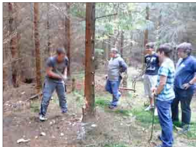
Kirmestanne holen – pure Manneskraft ist gefragt