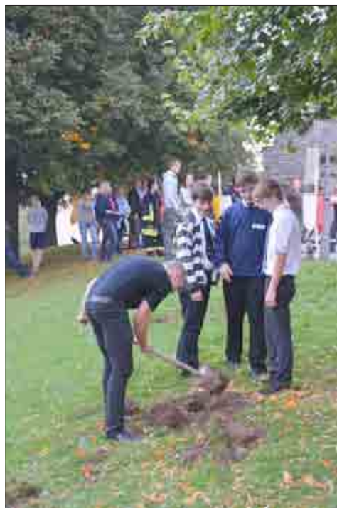
Ausgraben der Kirmes