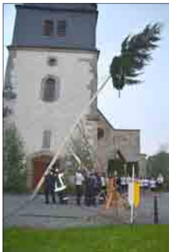
Aufstellen der Kirmestanne