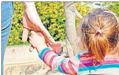
Fester Halt für kleine Hände: Das Jugendamt des Landkreises Eichsfeld sucht Pflegefamilien.