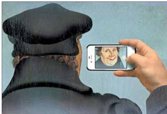
„Luthers Selfie“ von Wieslaw Smetek

Alle Veranstaltungen finden in Kooperation mit dem Burgforum e.V., Förderverein der Galerie in der Burg statt.